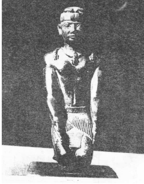
صورة رقم (2) تمثال برونزي للملك شباكو