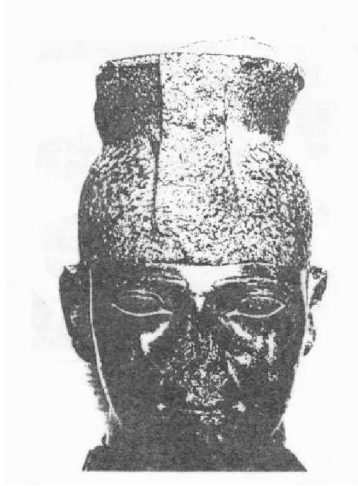
صورة رقم (3) رأس تمثال للملك تهارقو