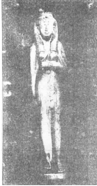
صورة رقم (4)