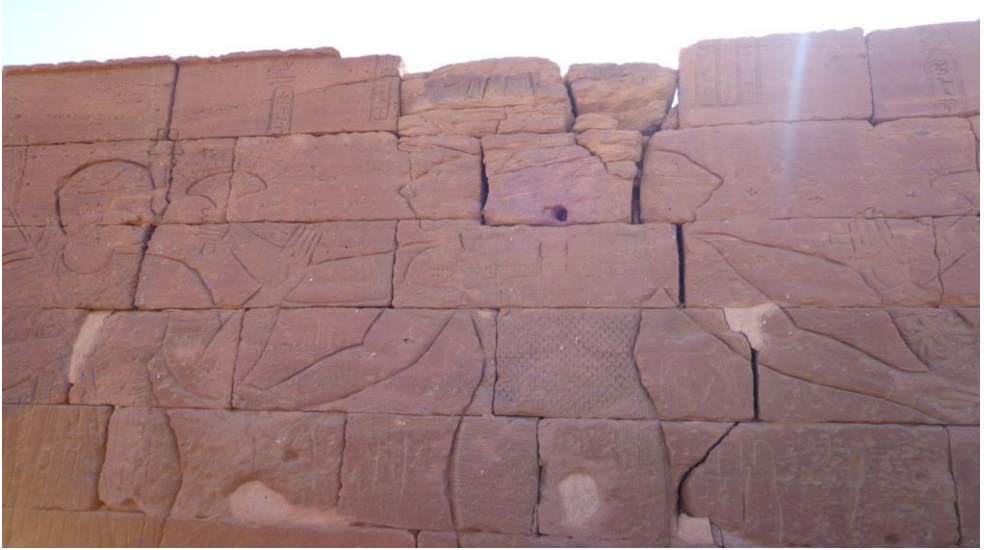
صورة "3" الإله أيديماك بأربعة أزرع وثلاثة رؤوس، بمعبد الأسد موقع النقعة، تصوير الباحث 2018م.