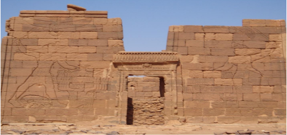
صورة "1" معبد الأسد بالنقعة، ويظهر في الواجهة صورتي الملك نتكامني وأمه، تصوير الباحث 2018م.