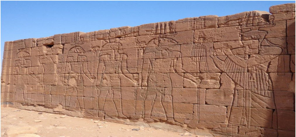
صورة "2" الإله أبيدماك يقود آلهة في موكب ديني، بمعبد الأسد موقع النقعة، تصوير الباحث 2018م.