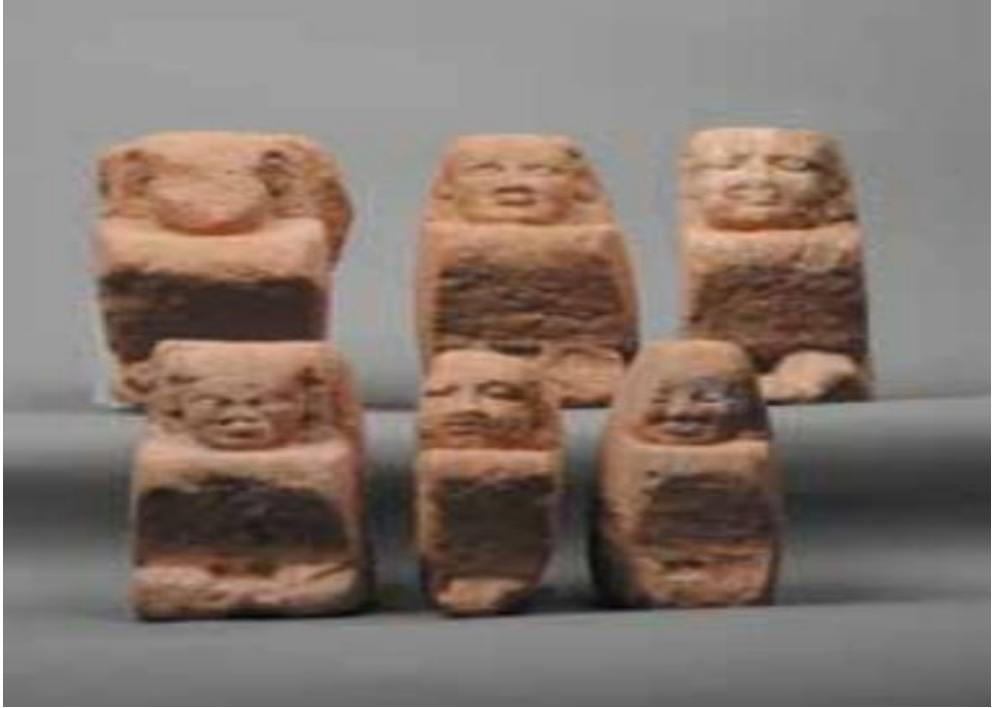
صورة رقم (5) مكعبات من موقع النقعة الاثري، : كارلا وديترش، دليل تعريفي مختصر عن موقع النقعة الاثري، ألمانيا ميونخ، دت، ص ١١